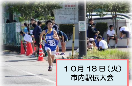
10月18日(火) 市内駅伝大会