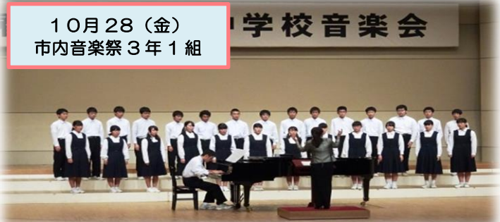
10月28(金) 市内音楽祭 3年1組