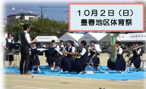
10月2日(日) 豊春地区体育祭