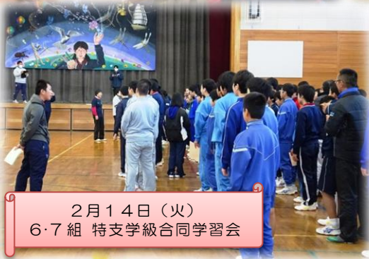
2月14日(火) 6・7組 特支学級合同学習会