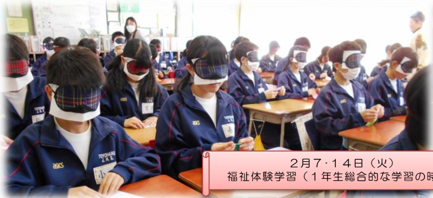
2月7・14日(火) 福祉体験学習(1年生総合的な学習の時間)