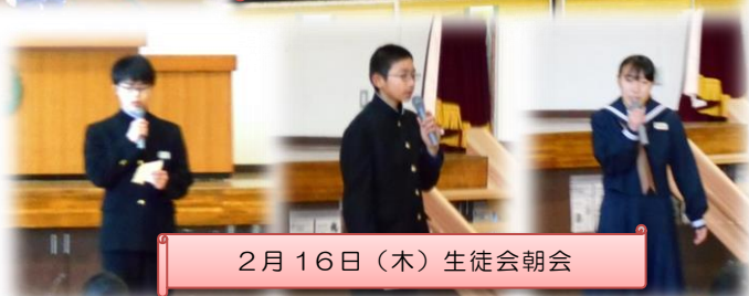
2月16日(木) 生徒会朝会