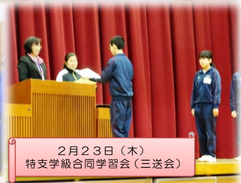
2月23日(木) 特支学級合同学習会(三送会)