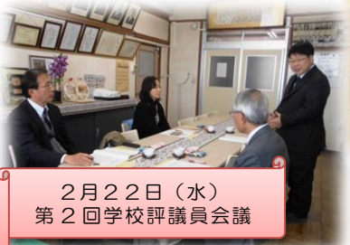
2月22日(水) 第2回学校評議員会議