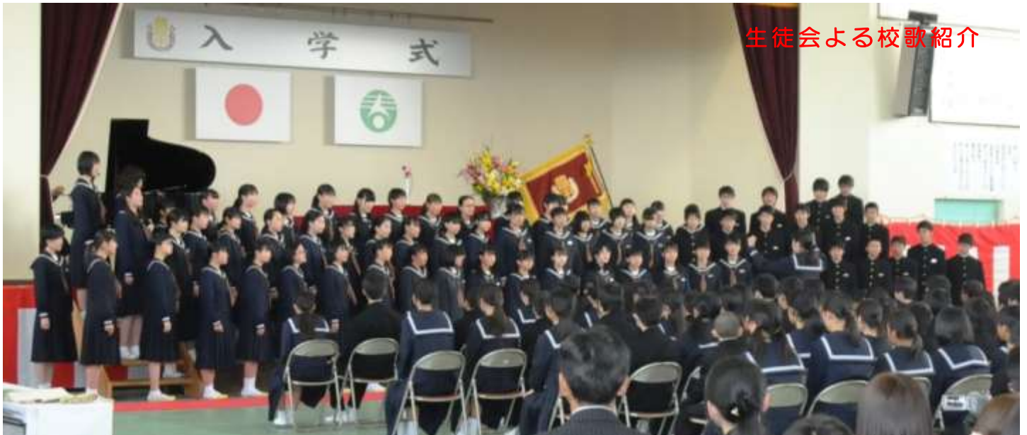
生徒会よる校歌紹介