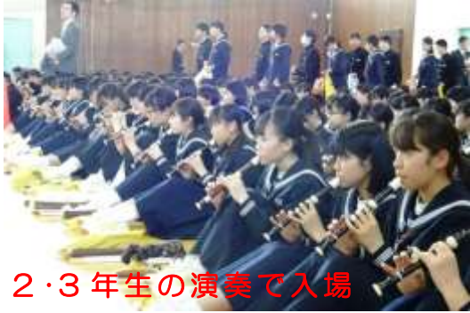
2・3年生の演奏で入場