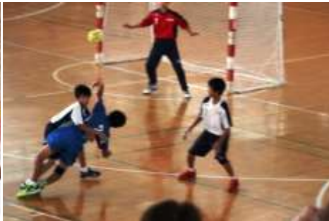
男子ハンドボール部