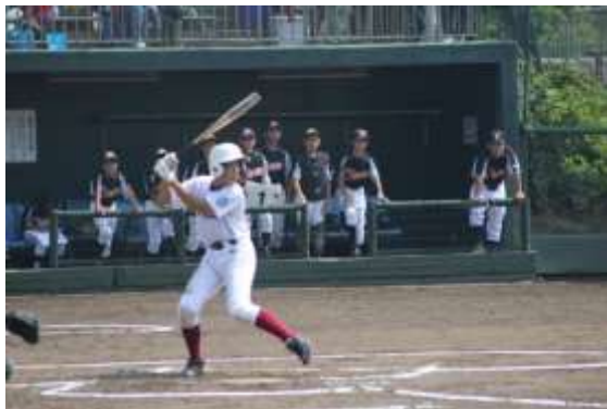
野 球 部