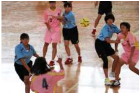
女子ハンドボール部