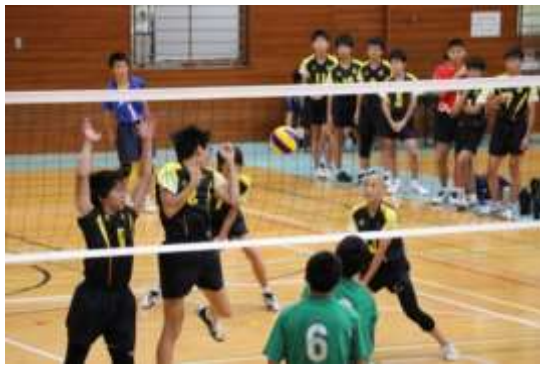
男子バレーボール部