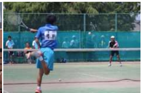
男子ソフトテニス部