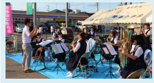
8月25日(日) 豊春夏まつり 豊春商店連合会主催の豊春夏まつりに、本校吹奏楽部が演奏し、夏まつりを盛り上げてくれました。