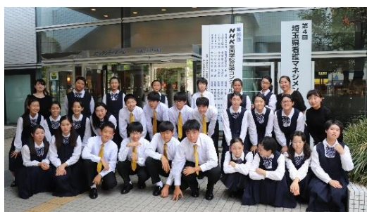
NHK 全国音楽コンクール埼玉県本選 に出場した混声合唱団

甲子園球場で繰り広げられた熱い夏と同じように、豊中生も大いに熱く燃え、受験勉強や部活動に取り組みました。学校総合体育大会県大会で始まった44日間の夏休みも終わりました。7月下旬から8月の中旬にかけての猛暑の中、新人戦等の目標に向けて取り組む1・2年生姿はとても頼もしく感じられました。