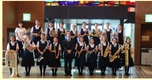
8月1日(木) 吹奏楽コンクール 東部地区大会 地区大会でみごと金賞、8月7日に同じく産業文化ホールで県大会に出場しました。写真は、県大会のものです。